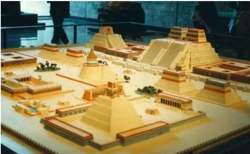
Рис. 4. Реконструкция храмового комплекса Темпло Майор

информация о них скрывалась, и лишь после Реформы при Доне Парфирио стало возможным «рассекретить» находки, касающиеся истории Америки времен ацтеков. Остатки нижней части храмового комплекса были найдены в феврале 1978 году при работах по прокладке кабеля возле Кафедрального собора, посвященного Успению Пресвятой Богородицы. Раскопки храмового комплекса длились до 1982 года. Храмовый комплекс Темпло Майор еще называют пирамидой Уицилопочтли. Считается, что пирамида возвышалась на 60 м над ритуальным районом города, а на её вершине стояло два храма в честь бога Уицилопочтли (бог солнца и войны) и бога Тлалока (бог дождя и плодородия).