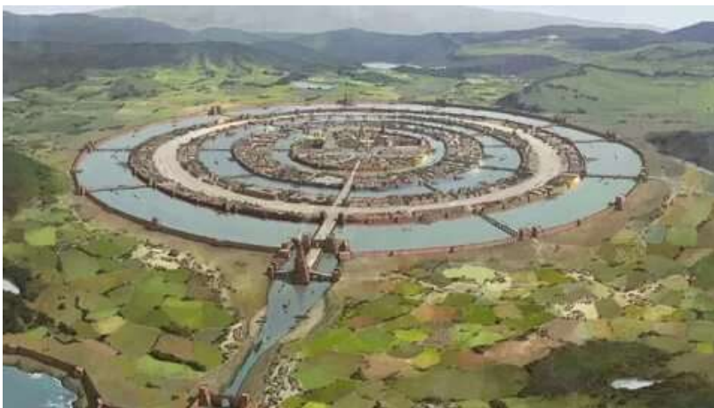
Рис. 1. Реконструкция центральной резиденции Атлантиды по описанию Платона