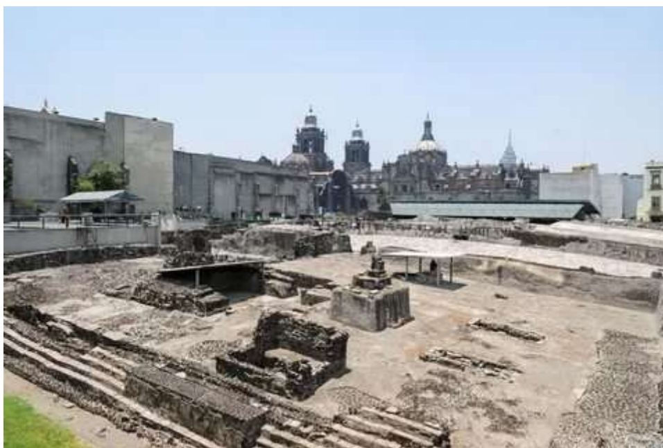
Рис. 3. Остатки строений древнего Теночтитлана

Можно отметить, что в описаниях Платоном столицы Атлантиды и самой Атлантиды, и описании Теночтитлана с окружающей местностью испанцами многое совпадает. Совпадают данные о добыче и использовании различных металлов в Атлантиде и в современной Мексике. У испанцев отсутствуют сведения о геотермальном источнике, который снабжал столицу атлантов горячей водой более 10000 лет назад. Этот источник за прошедшие тысячелетия мог либо просто исчезнуть, либо вода в нем могла стать холодной. Нет больших противоречий и в описании Платоном храмов в столице Атлантиды с видом обнаруженного древнего храмового комплекса Темпло Майор (рис. 3-4) в Мехико, бывшем Теночтитлане. Необходимо отметить, что практически весь город с храмовым комплексом была уничтожена в 1521 году испанскими конкистадорами во главе с Эрнаном Кортесом. Про город ацтеков забыли на несколько сотен лет, пока при каких-то работах в начале XIX века не были обнаружены огромные странные статуи. Какое-то время