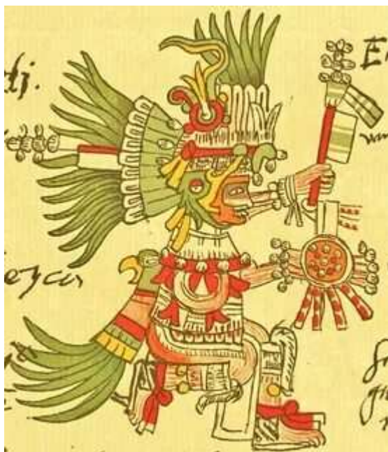
Рис. 5. Уицлопочтли - бог солнца и войны. Изображение в Кодексе Теллерано-Ременсиса