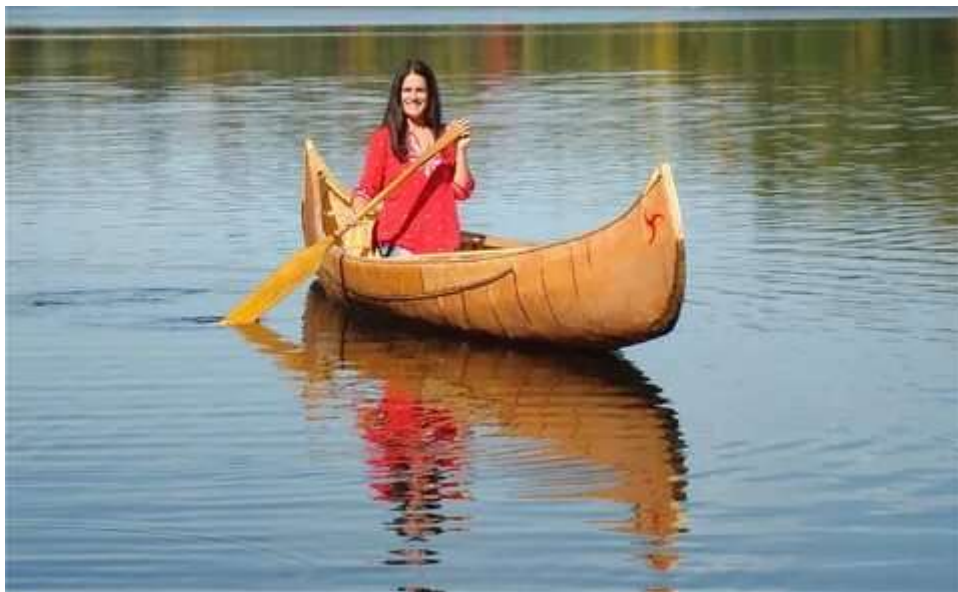
Рис. 9. Плавание индейцев на пирогах или каноэ

Попробуем разобраться, что же случилось с Ацтланом или возможной столицей древней Атлантиды около 10000 лет тому назад. В диалоге «Тимэй» египетский жрец описывает гибель столицы Атлантиды следующим образом: «В последствии же времени, когда происходили страшные землетрясения и потопа , в один день и бедственную ночь вся ваша воинская сила разом провалилась в землю; да и остров Атлантида исчез, погрузившись в море . Поэтому и тамошнее море оказывается теперь несудоходным и неисследимым: плаванию препятствует множество окаменелой грязи , которую оставил за собой осевший остров ».