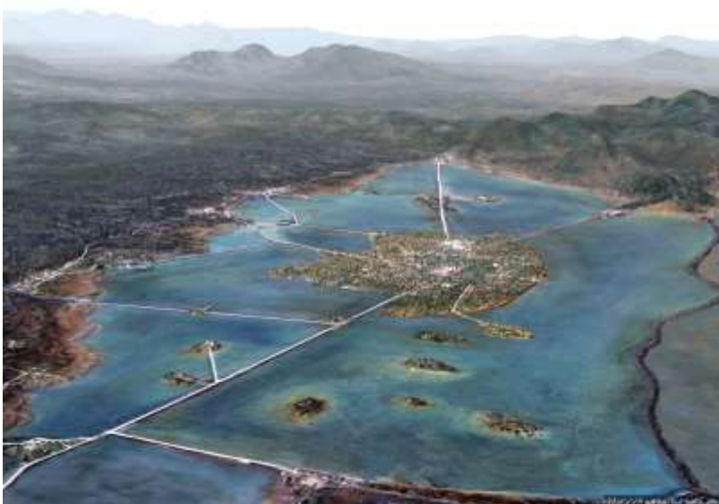
Рис. 2. Реконструкция столицы ацтеков Теночтитлана. Мексика

завоевателей. В целом, очень похожие реконструкции – на обеих реконструкциях показаны остров, озеро и горы. На реконструкции столицы Атлантиды показаны кольцевые дамбы, а на реконструкции Теночтитлана показаны многочисленные островки, которые вполне могут являться остатками разрушенных дамб. Интересно сравнить отдельные фрагменты в описании местности и столицы Атлантиды Платоном, в описании Теночтитлана испанскими завоевателями и описания современного Мехико в Википедии.