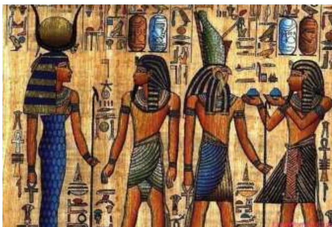
Рис. 6. Символы божественной власти (посохи, «анхи» и лампа на голове) древнеегипетских владык

Вероятно, египетские и индейские жрецы имели техническое описание технологии электричества, доставшееся им от древней высокоразвитой цивилизации, но понять этот материал они были не в состоянии. Поэтому и появились фрески и другие изображения, где элементы электрической сети являются символом божественного могущества фараонов или божеств. Следует обратить внимание, что изображение Уицлопочтли на рис. 5 является только частью страницы Кодекса и джед-изолятор показан дважды. И божество пытается соединить элементы электрической сети между собой.