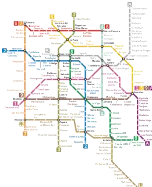
Рис. 7. Схема метрополитена Мехико

страна объявила дефолт. Но достаточно комфортное метро строилось (или откапывалось?). Фотографий строительства метро в Мехико в Интернете найти не удалось, имеются только фотографии уже функционирующего метро.