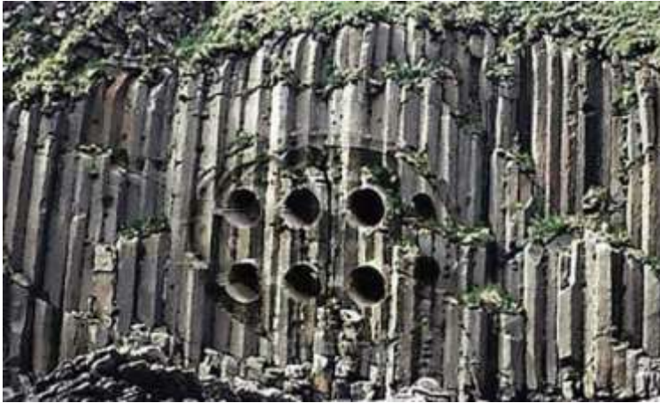
Рис. 1. Остатки древнего стального механизма на горе Байгунишань в Китае

Заблуждение археологов при периодизации древнейшей эпохи на каменный, бронзовый и железный века, заключается в том, что они не учли, что скорость коррозии железа, при одних и тех же условиях, в десятки раз больше скорости коррозии бронзы. В нормальных атмосферных условиях скорость коррозии стали почти в 20 раз больше скорости коррозии бронзы, а в морской воде – почти в 40 раз. Если на массивном железном станке выточить изделие из бронзы и оставить их вместе на открытом воздухе на века, то через 1000 лет от железного станка не останется даже ржавого пятна, а покрытое окислами бронзовое изделие сохранится. И железные изделия, произведенные на тысячелетия раньше или одновременно с бронзовыми изделиями, просто не могли сохраниться до нашего времени. Но это не означает, что их не было. Как нельзя утверждать, что в древности не использовалась древесина при строительстве домов. Остатки древесины, также как и железных изделий, не могли сохраниться за столь долгий срок. А иначе, если следовать логике археологов, деревянный век начался примерно 1000 лет назад, так как самое старое в мире деревянное строение (рис. 2) находится на Фарерских островах (Дания) и насчитывает около 1000 лет (подтверждено церковными документами).