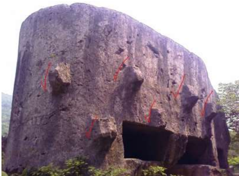
Рис. 9. Мегалит Яньшаньского карьера в Китае.

Можно представить себе удивление Тура Хейердала, если бы он знал, что в Китае имеются мегалиты (рис. 9), изготовленные по той же технологии, что и мегалиты в Перу (рис. 10),