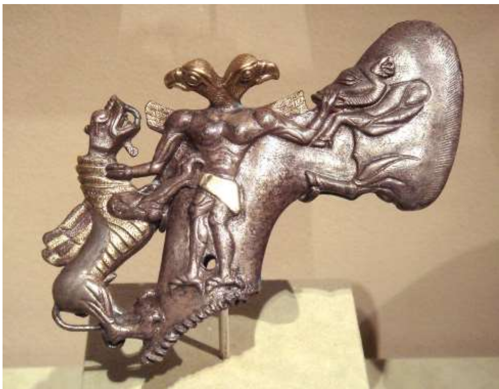
Рис. 3. Бронзовый топор Бактрийско-Маргианской культуры

Обнаружена и названа советским археологом Виктором Сарияниди в 1976 году. Одна из цивилизаций бронзового века (рис. 3-4), которая существовала на территории восточного Туркменистана, южного Узбекистана, северного Афганистана и западного Таджикистана с XXIII по XVIII вв. до н. э. - в одно время с Индской цивилизацией в Пакистане и Древнеавилонским царством в Месопотамии. Ряд исследователей относят данную культуру к III тысячелетию до н.э. и ранее.