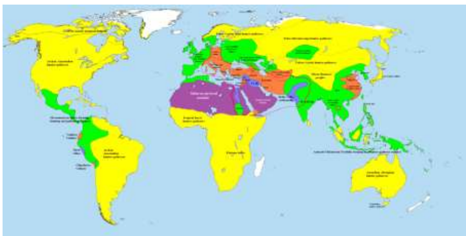
Рис. 5. Территории планеты, где найдены древние бронзовые изделия. Охотники/собиратели ■ Скотоводы-кочевники ■ Простые земледельческие сообщества ■ Сложные земледельческие сообщества/Вождество ■ Ранние цивилизации ■ необитаемые зоны* Розовая граница — бронзовый век на 2000 г. до н. э.

Карта планеты с территориями, где археологами найдены древние бронзовые изделия (рис. 5), хорошо совпадает с картой с территориями, на которых более 10000 лет назад одновременно возникли очаги древнего высокоразвитого земледелия (рис. 6), а также с картой с расположением дольменов на планете (рис. 7). Дольмены, являющиеся защитными сооружениями от метеоритной бомбардировки, строились с применением высокотехнологичной техники более 10250 лет назад. Совпадение трех вышеуказанных карт не может быть случайностью и является еще одним аргументом в пользу версии существования на планете высокоразвитого государства более 10000 лет назад.