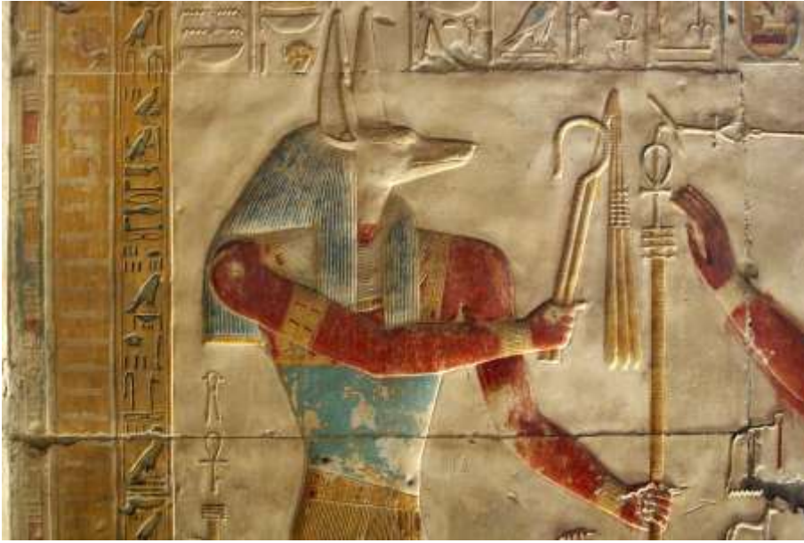
Рис. 12. Настенное изображение. Египет

Подводя итог, можно отметить, что по всей планете имеются следы одной и той же древней высокоразвитой цивилизации. И, конечно, это следы не египетского государства, технически безграмотно подражающего цивилизации древних «богов». Поражает лишь то, что никто из ученых не оспаривает периодизацию веков Кристиана Томпсона (каменный, бронзовый и железный века), не смотря на то, что ее некорректность вполне очевидна даже без факта существования древнего высокоразвитого государства.