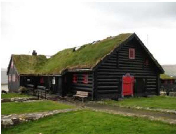
Рис. 2. Старейший обитаемый деревянный дом в мире на Фарерских островах

Заблуждение археологов при периодизации древнейшей эпохи на каменный, бронзовый и железный века, заключается в том, что они не учли, что скорость коррозии железа, при одних и тех же условиях, в десятки раз больше скорости коррозии бронзы. В нормальных атмосферных условиях скорость коррозии стали почти в 20 раз больше скорости коррозии бронзы, а в морской воде – почти в 40 раз. Если на массивном железном станке выточить изделие из бронзы и оставить их вместе на открытом воздухе на века, то через 1000 лет от железного станка не останется даже ржавого пятна, а покрытое окислами бронзовое изделие сохранится. И железные изделия, произведенные на тысячелетия раньше или одновременно с бронзовыми изделиями, просто не могли сохраниться до нашего времени. Но это не означает, что их не было. Как нельзя утверждать, что в древности не использовалась древесина при строительстве домов. Остатки древесины, также как и железных изделий, не могли сохраниться за столь долгий срок. А иначе, если следовать логике археологов, деревянный век начался примерно 1000 лет назад, так как самое старое в мире деревянное строение (рис. 2) находится на Фарерских островах (Дания) и насчитывает около 1000 лет (подтверждено церковными документами).