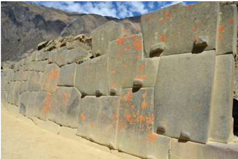
Рис. 10. Незаконченная стена из мегалитической кладки в Ольянтайтамбо (Перу)

а в Австралии находится наземный указатель для полетов дирижаблей (рис. 11), выполненный в «египетских» мотивах (рис. 12). Геоглиф был обнаружен с воздуха 26 июня 1998 года пилотом Тревором Смитом. Самолёт летел на высоте 3000 метров. Изображение человека находится на плато Финнис Спрингс ( Южная Австралия ) в 60 км от посёлка Марри. Поэтому изображение человека получило название «Человек Мари». «Человек Мари» является самым большим геоглифом на Земле, он имеет в длину 2,7 км , линии фигуры имеют глубину 20–30 см в глубину и до 35 м (в среднем 10 м) в ширину. Думается, что «египетский» стиль являлся вовсе не египетским, а являлся подражанием стилю более древнего государства, знания о котором сохранились и были обнаружены жрецами Египта в период фараонов.