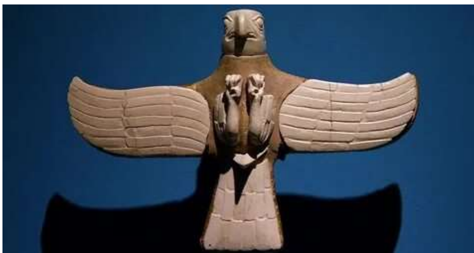
Рис. 4. Изделие Бактрийско-Маргианской культуры

Рассмотренный выше материал позволяет ориентировочно оценить периоды появления новых государств (цивилизаций), независимых друг от друга и, по мнению автора, использующих изделия, сооружения и знания древней высокоразвитой цивилизации: