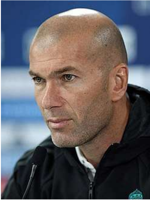
Рис. 8. Зинед́ин Язид Зидан

Периоды времени к которым относятся важнейшие ископаемые находки кроманьонцев следующие: Европа, Африка и Россия - 25-40 тысяч лет назад; Азия, Австралия - 10-40 тысяч лет назад; Америка - 11-23,6 тысяч лет назад. Из анализа указанных периодов времени можно сделать два предварительных вывода – первый о том, что при катастрофическом событии примерно 10250 лет назад в большей степени пострадали Европа, Африка и Россия, и в меньшей степени – Азия, Австралия и Америка; второй вывод о том, что в древнем высокоразвитом государстве применялась обязательная кремация умерших, иначе находок останков кроманьонцев было бы значительно больше. Следует напомнить, что в последующее время кремация умерших выполнялась в Древней Греции и Древнем Риме, а также в Индии. Первый вывод соответствует версии гибели древнего государства из-за гигантских цунами, возникших в Атлантическом океане при гравитационном захвате Луны Землей.