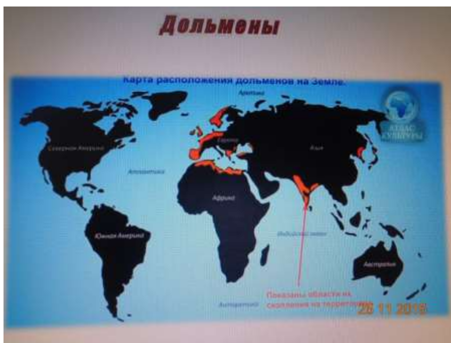
Рис. 7. Расположение дольменов на планете. В настоящее время дольмены обнаружены и в Америке