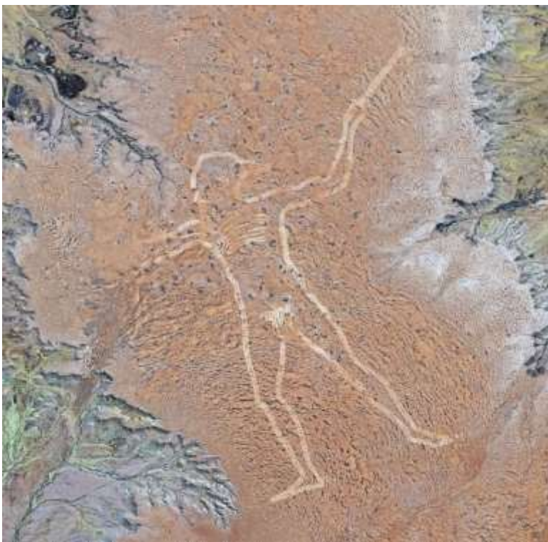
Рис. 11. Геоглиф «Человек Марри». Австралия

а в Австралии находится наземный указатель для полетов дирижаблей (рис. 11), выполненный в «египетских» мотивах (рис. 12). Геоглиф был обнаружен с воздуха 26 июня 1998 года пилотом Тревором Смитом. Самолёт летел на высоте 3000 метров. Изображение человека находится на плато Финнис Спрингс ( Южная Австралия ) в 60 км от посёлка Марри. Поэтому изображение человека получило название «Человек Мари». «Человек Мари» является самым большим геоглифом на Земле, он имеет в длину 2,7 км , линии фигуры имеют глубину 20–30 см в глубину и до 35 м (в среднем 10 м) в ширину. Думается, что «египетский» стиль являлся вовсе не египетским, а являлся подражанием стилю более древнего государства, знания о котором сохранились и были обнаружены жрецами Египта в период фараонов.